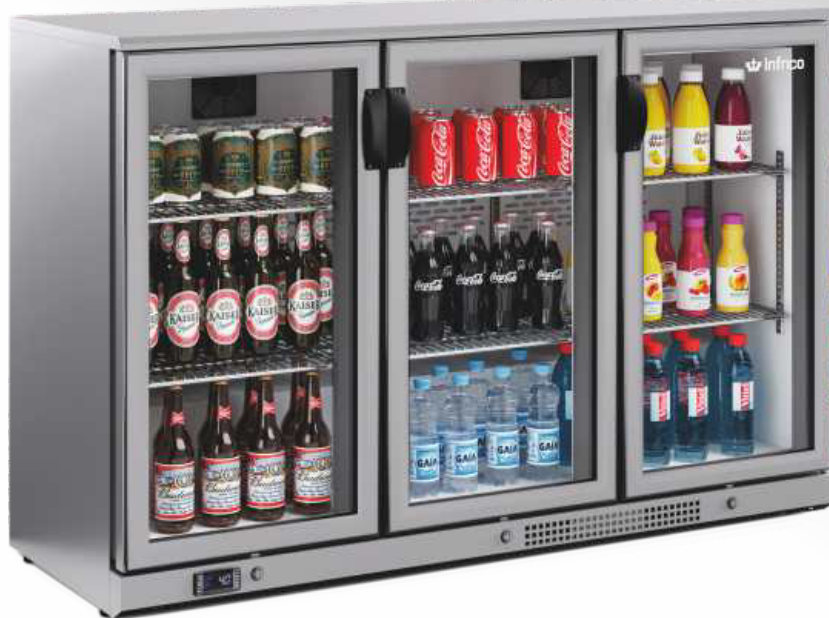
ERV 35 II

Temperature and defrost regulated by a digital controller. Ventilated condensation system. Forced evaporation system. Evaporative tray.