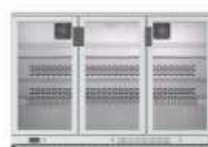
ERV 35 II

900 x 510 x 920 mm. Temp. +4°C/+12°C C. Clima. 4 / 38°C 230V/1ph/50Hz