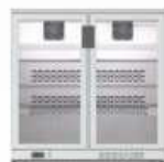
ERV 25 II

600 x 510 x 920 mm. Temp. +4°C/+12°C C. Clima. 4 / 38°C 230V/1ph/50Hz